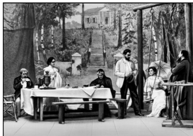
Escena de L'oncle Vània al Teatre de l'Art de Moscou, 1899