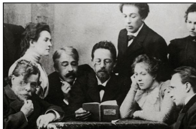
Txèkhov llegint La gavina amb Stanislavski i Knipper al Teatre de l'Art de Moscou, 1899

L'estudiant va dir bona nit a les viudes i se'n va anar. Van venir de nou les tenebres, i se li van gelar les mans. Bufava un vent salvatge, l'hivern tornava de debò i no semblava que l'endemà passat hagués de ser Pasqua.