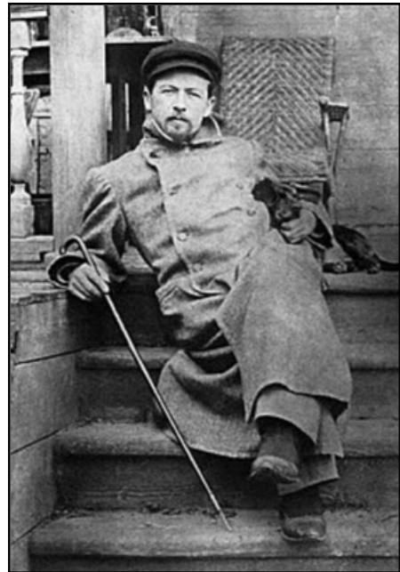
Txèkhov l'any 1897 a la seva finca de Melikhovo

No fa fred, i és tan cert que no fa fred que un es pot atrevir a passejar amb barret, abric i bastó. Ni tan sols glaça a la nit. [...] El sol brilla tan esplèndid, tan càlid i tan tendre, que sembla haver begut i menjat fins a atipar-se, com si hagués trobat un vell amic. Fa olor d'herba jove, de fems, de fum, de florit, de tota mena d'escombraries, d'estepa i d'alguna cosa molt particular... Allà on mireu, a la natura tot són preparatius, tràfecs, feinejar sens fi. En essència, arriba la primavera.