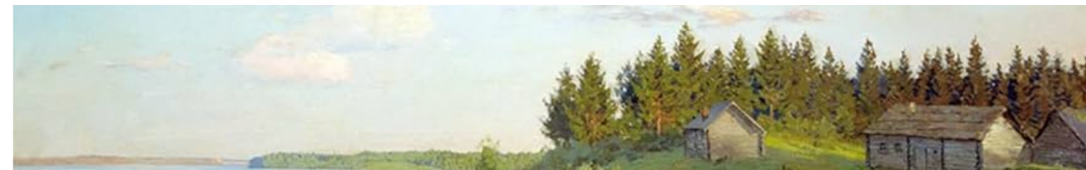
Isaac Levitan, paisatge de poble pesquer (fragment)

«L'estudiant» (fragment), 1894 [trad. d'Arnau Barrios]