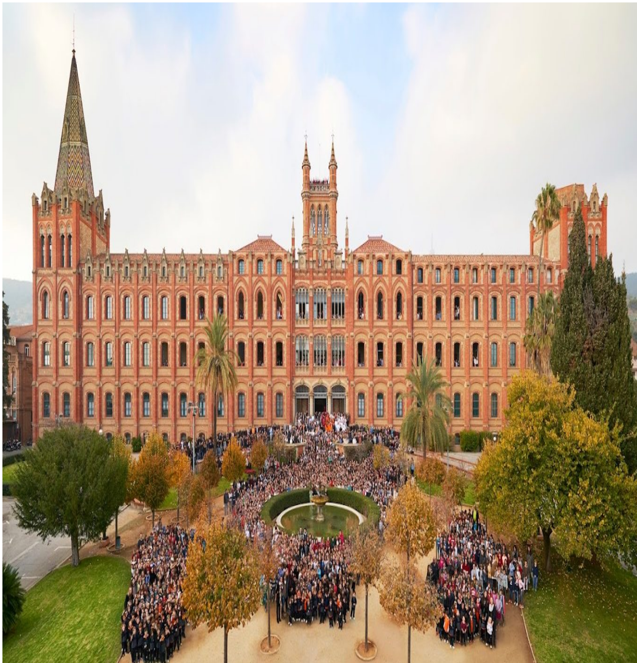
L'escola Jesuïtes Sarrià – Sant Ignasi.

Segur de la Companyia de Jesús”, un sistema que proporciona “eines per prevenir i identificar possibles situacions d’abús i violència de tota mena”.